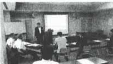
ワークショップ風景(イメージ)