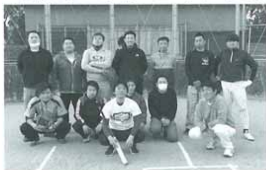
※集合写真時のみマスクを外しております。

当青年部では、4月14日に令和3年度事業の第1回目となる親睦ソフトボール大会を行いました。