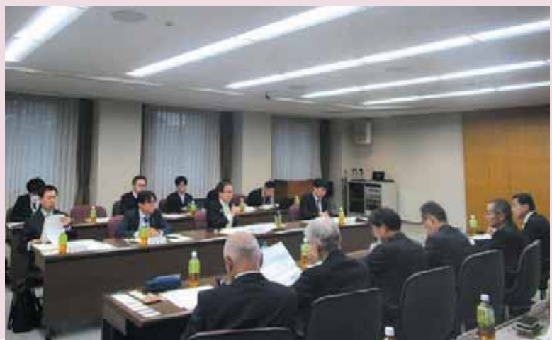
▲意見交換を行う池田香川県知事