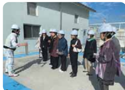
▲丸亀市浄化センター見学