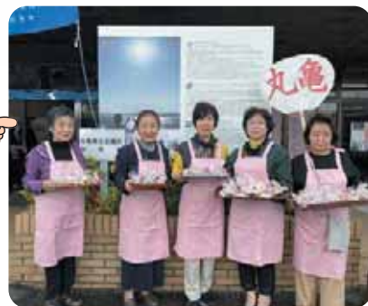
▲瀬戸芸お接待 参加者