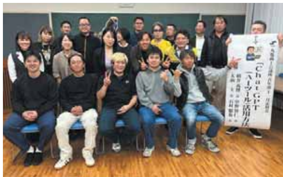
▲講習会後に参加メンバーたちと記念撮影

青年部では、11月20日(木)、AIツールの活用を学ぶことを目的として、標記講習会を開催しました。