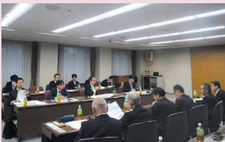
▲意見交換を行う池田香川県知事