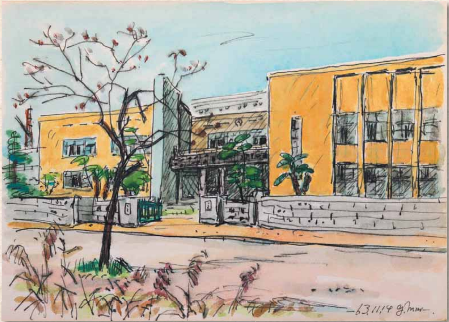
大手前丸亀中学・高等学校 (スケッチ: 村上泰郎 所蔵: 丸亀市立資料館)