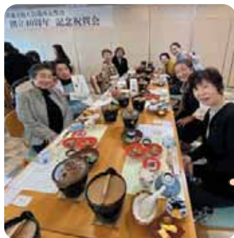
▲善通寺40周年記念式典参加者

10月25日(土)、3年に1度開催される瀬戸内国際芸術祭の秋会期にあわせて、本島行のフェリーに乗船するお客様にお菓子のお接待を実施し、出発する船に手を振りお見送りしました。今後も色々な活動を通して心と心の繋がりを大切にしていきたいと思います。