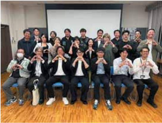
▲丸亀の「まる」ポーズで記念撮影

当青年部では、4月17日(金)に、丸亀市都市計画課や産業観光課の方々を講師として招き、「まちなか再生・大手町地区4街区整備事業」について学びました。