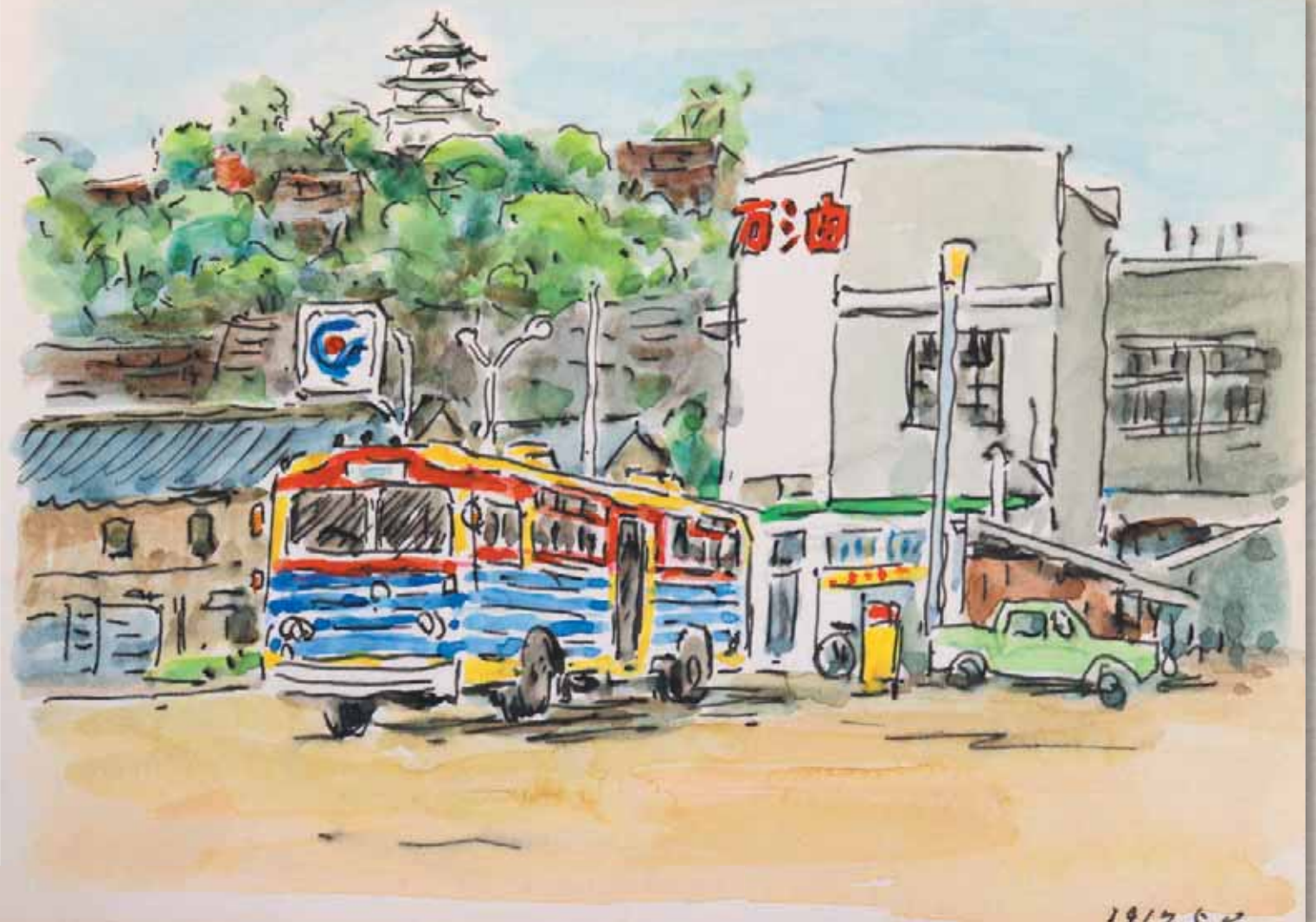
通町周辺から丸亀城付近(スケッチ:村上泰郎 所蔵:丸亀市立資料館)