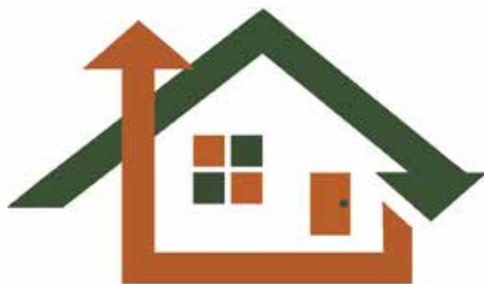
〈ロゴマーク〉 (株)大澤工務店

(参考) 穴吹デザインカレッジでは、デザインの専門家の指導のもと将来プロとしての活躍を目指す学生が、企業から依頼を受け、デザイン制作を行う活動を実施しています。