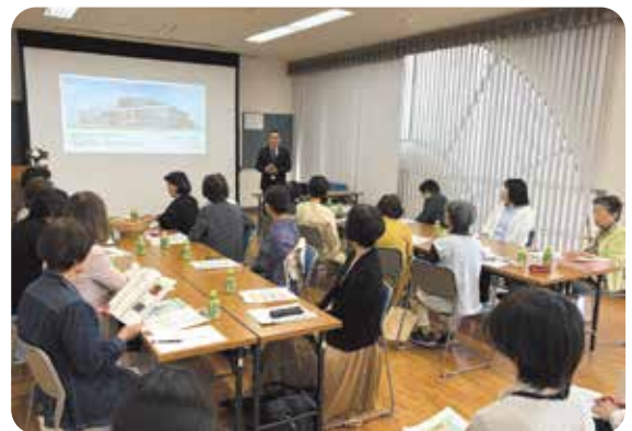
▲まちづくり出前講座

将来に備えて、贈与や相続の事前対策やシミュレーションも行います。 どんな些細なことでもお気軽にご相談ください。