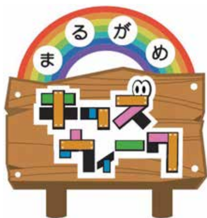
〈ロゴマーク〉 丸亀市キッズウィーク推進協議会