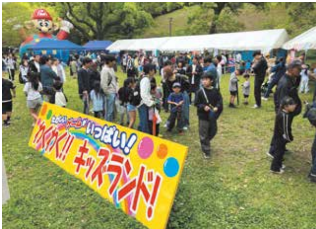
▲イベントを楽しみに並ぶ子どもたち

第77回「丸亀お城まつり」が5月3日、4日の2日間にわたり丸亀城周辺で開催され、当青年部も、丸亀城内において、恒例の「わくわくキッズランド」と題した子ども向けのイベントを実施しました。