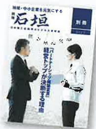
「月刊石垣」別冊 「パートナーシップ構築宣言」 特集号