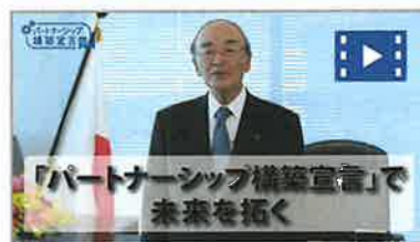
「パートナーシップ構築宣言」プロモーションビデオ ～アフターコロナを勝ち抜く トップの決断!～